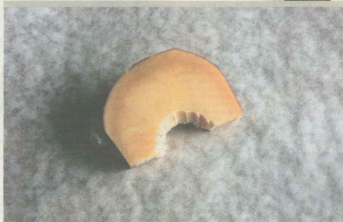
Een stuk Kees.

Kees is eigenlijk al oud, blijkt op het internet. In elk geval een jaar geleden werd het al verkocht in Leiden en Alphen aan de Rijn. Nu wagen de makers van deze specifieke versie